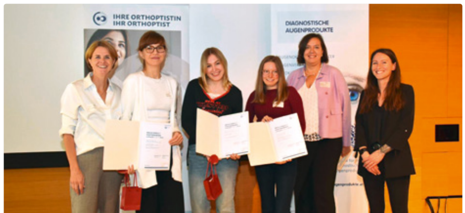
Mediconsult Poster Award